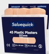
Plaster Plastikowy Salvequick REF 6036

Myjki do ran Salvequick zastępują waciki i płyn do przemywania w butelce. Zawartość: 40 myjek do ran Salvequick nasączonych 0,9% roztworem soli kuchennej. Pakowane pojedynczo. Pasują do apteczki Cederoth Wound Care Dispenser.