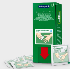
Myjki do ran Salvequick x 40 szt. REF 3227

Myjki do ran Salvequick zastępują waciki i płyn do przemywania w butelce. Zawartość: 20 myjek do ran Salvequick nasączonych 0,9% roztworem soli kuchennej. Pakowane pojedynczo. Pasują do apteczki pierwszej pomocy.