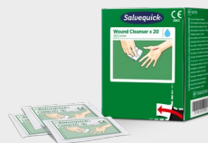
Myjki do ran Salvequick x 20 szt. REF 323700

150 ml sterylnego roztworu soli kuchennej do oczyszczania oraz przewidywania brudu i zanieczyszczeń z oczu i ran. Spray wielokrotnego użytku. Zachowuje sterylność mimo wielokrotnego używania. Okres przydatności do użycia 5 lat.