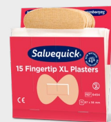
Plaster Salvequick na Opuszki Palców, REF 6454

Każdy wkład uzupełniający zawiera 21 plastrów (14 szt. o wym. 80 x 30 mm i 7 szt. o wym. 80 x 60 mm). 6 wkładów/ opakowanie.