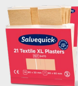
Plastry Tekstylne Dużych Rozmiarów Salvequick, REF 6470

Każdy wkład uzupełniający zawiera 40 plastrów (24 szt. o wym. 72 x 19 mm i 16 szt. o wym. 72 x 25 mm). 6 wkładów/ opakowanie.