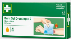
Cederoth Burn Gel Dressing REF 901900

Sterylna opaska uniwersalna odpowiednia na palce dłoni i stóp. Jasne instrukcje nadrukowane bezpośrednio na opakowaniu.