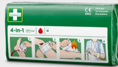
Opatrunki do tamowania krwawienia Cederoth 4-w-1 REF 1910

Bezklejowy, samoprzylepny plaster, który można łatwo oderwać na określonej długości. Odpowiedni na każdego rodzaju ranę bez względu na warunki użytkowania: wysoką lub niską temperaturę, otoczenie suche lub mokre. Nie odkleja się w wodzie. Wkład do dozownika Soft Foam Bandage 2-in-1 Dispenser.