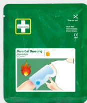
Burn Gel Dressing 20 x 20cm REF 51011015

Zapewnia szybkie schłodzenie i skutecznie uśmierza ból przy oparzeniach oraz poparzeniach słonecznych. Cederoth Burn Gel chłodzi równie skutecznie jak letnia woda i przyspiesza proces gojenia.