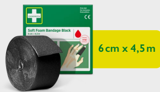
Cederoth Soft Foam Bandage Black 6 cm x 4,5 m REF 51011021

Bezklejowy, samoprzylepny plaster, który można łatwo oderwać na określonej długości. Odpowiedni na każdego rodzaju ranę bez względu na warunki użytkowania: wysoką lub niską temperaturę, otoczenie suche lub mokre. Nie odkleja się w wodzie. Wkład do apteczki First Aid & Burn Station.