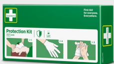
Zestaw ochronny Cederoth REF 2596

Żel na bazie wody na mniejsze oparzenia różnego rodzaju, m.in. słoneczne, oraz pokrywkę słoneczną. Działa jak tymczasowa warstwa ochronna, która chłodzi i łagodzi podrażnienie skóry, uśmierając ból. Można używać wielokrotnie.