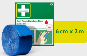
Cederoth Soft Foam Bandage Blue 6 cm x 2 m REF 51011011

Bezklejowy, samoprzylepny plaster, który można łatwo oderwać na określonej długości. Odpowiedni na każdego rodzaju ranę bez względu na warunki użytkowania: wysoką lub niską temperaturę, otoczenie suche lub mokre. Nie odkleja się w wodzie. Wkład do apteczki First Aid & Burn Station.