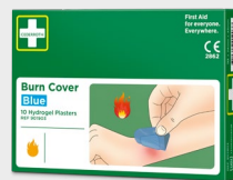
Cederoth Burn Cover REF 901903

Kompres na oparzenia, który szybko chłodzi i skutecznie uśmierza ból przy oparzeniach I i II stopnia. Sterylny kompres o wymiarach 20 x 20 cm.