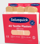
Plaster Tekstylny Salvequick REF 6444

Każdy wkład uzupełniający zawiera 45 plastrów (27 szt. o wym. 72 x 19 mm i 18 szt. o wym. 72 x 25 mm). 6 wkładów/ opakowanie.