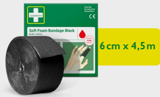
Cederroth Soft Foam Bandage Black 6 cm x 4,5 m, REF 51011021

Lijmvrije, zelfhechtende pleisters die gemakkelijk op de gewenste grootte kunnen worden afgescheurd. Passen op alle kleinere wonden en blijven zitten ongeacht warmte, koude, natheid of droogte. Navulling bij Cederroth Soft Foam Bandage 2-in-1 Dispenser.