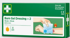
Cederroth Burn Gel Dressing 10x10 cm, REF 901900

Steriel universeel verband speciaal geschikt voor vingers en tenen. Er zijn duidelijke instructies direct op de verpakking gedrukt.