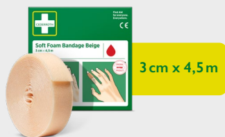
Cederroth Soft Foam Bandage Beige 3 cm x 4,5 m, REF 51011018

Lijmvrije, zelfhechtende pleisters die gemakkelijk op de gewenste grootte kunnen worden afgescheurd. Passen op alle kleinere wonden en blijven zitten ongeacht warmte, koude, natheid of droogte. Navulling bij Cederroth Soft Foam Bandage 2-in-1 Dispenser.