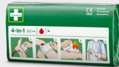
Cederroth 4-in-1 Bloedstelpende verbanden, REF 1910

Lijmvrije, zelfhechtende pleisters die gemakkelijk op de gewenste grootte kunnen worden afgescheurd. Passen op alle kleinere wonden en blijven zitten ongeacht warmte, koude, natheid of droogte. Navulling voor het eerstehulpstation.