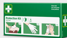
Cederroth Protectiepakket REF 2596

Op water gebaseerde gel voor kleinere brandwonden, verbrandingen en zonnebrand. Functioneert als een tijdelijke beschermende barrière die de huid koelt en kalmeert en daarmee de pijn vermindert. Kan verscheidene keren worden gebruikt.