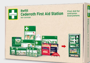
Cederroth Navulpakket Voor Eerstehulpstation REF 51011039

Salvequick Wondreinigers maken watten en flessen ontsmettingsmiddel overbodig. Inhoud: 20 Salvequick wonddoekjes met 0,9% zoutoplossing. Individueel verpakt. Geschikt voor de First Aid Station.