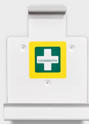
Wandhouder REF 51000008

Met Cederroth eerstehulpproducten kan wie dan ook eerste hulp verlenen. De producten zijn eenvoudig vormgegeven en voorzien van duidelijke instructies. Daardoor kunnen ze altijd, door iedereen, overal en in elke samenhang worden gebruikt.