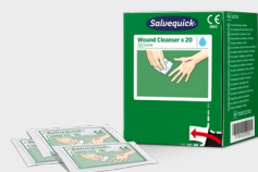
Salvequick Wondreiniger 20 stuks REF 323700

Salvequick Wondreinigers maken watten en flessen ontsmettingsmiddel overbodig. Inhoud: 40 Salvequick wonddoekjes met 0,9% zoutoplossing. Individueel verpakt. Geschikt voor Eerste Hulp-kast dubbele deur en Wound Care Dispenser.