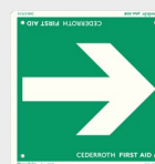
Richtingpijl REF 1735