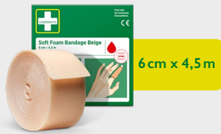
Cederroth Soft Foam Bandage Beige 6 cm x 4,5 m, REF 51011020

Lijmvrije, zelfhechtende pleisters die gemakkelijk op de gewenste grootte kunnen worden afgescheurd. Passen op alle kleinere wonden en blijven zitten ongeacht warmte, koude, natheid of droogte. Navulling bij Cederroth Soft Foam Bandage 2-in-1 Dispenser.