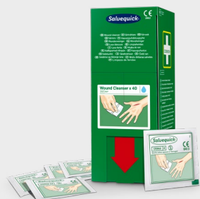
Salvequick Wondreiniger 40 stuks REF 3227

Spray voor de reiniging en het wegspoelen van stof en vuil uit ogen en wonden. Heeft een totale spoeltijd van 5 minuten. De spray kan verscheidene keren worden gebruikt en is tot de laatste druppel steriel. Bevat 150 ml. Houdbaarheidstermijn 5 jaar.