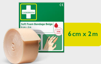
Cederroth Soft Foam Bandage Beige 6 cm x 2 m, REF 51011019

Het is een zelfklevende lijmvrije pleister en plakt daardoor niet vast aan huid of haar. Is perfect geschikt voor vingers of tenen. Gemakkelijk om kleine handen te wikkelen of als u een kleinere wond hebt. Navulling bij Cederroth Soft Foam Bandage 2-in-1 Dispenser.