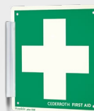
Eerste Hulp-Kruis REF 1738