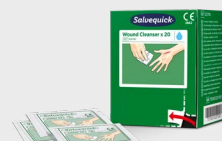
Salvequick Wundreiniger 20 Stk. REF 323700

Der Salvequick Wundreiniger ist der praktische Ersatz für Watte und Wundreinigerlösung. Inhalt: 40 x Salvequick Wundreiniger mit 0,9 % Kochsalzlösung. Passt in die Pflasterspender Plus.