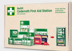
Nachfüllpaket für Cederroth Erste-Hilfe-Station REF 51011039

Kältekomresse, schmerzlindernd und abschwellend, z. B. bei Verstauchungen. 6 St./Verpackung.