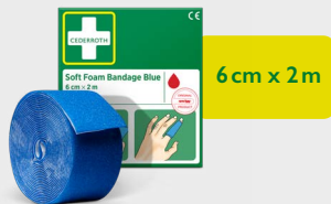
Cederroth Soft Foam Bandage Blue 6 cm x 2 m, REF 51011011

Klebstofffreier, selbsthaftender Verband, der sich leicht passgenau abreißen lässt. Es eignet sich für alle kleineren Wunden und sitzt auch bei Hitze, Kälte oder Nässe sicher. Nachfüllpackung für die Erste-Hilfe-Station.