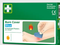
Cederroth Burn Cover REF 901903

Schnelle Abkühlung und effektive Schmerzlinderung bei Brandwunden und Sonnenbrand. Die Komresse kühlt genauso wirksam wie lauwarmes Wasser und beschleunigt damit den Heilungsprozess. Wasserlösliche, sterile Komresse 10 x 10 cm, 2 St./Verp.