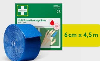
Cederroth Soft Foam Bandage Blue 6 cm x 4,5 m, REF 51011010

Ideal zum Verbinden kleinerer Wunden. Auch in beige und schwarz erhältlich.