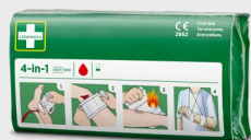
Cederroth 4-in-1 Blutstiller REF 1910

Steriler Universalverband, besonders geeignet für Finger und Zehen. Klare Anleitungen direkt auf der Verpackung aufgedruckt.