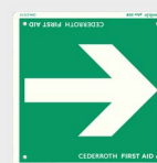
Schild Richtungspfeil REF 1735