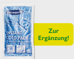
Kälte-Sofortkomresse REF 219600

Decke mit wärmereflektierender Aluminiumseite, die vor Unterkühlung schützt.