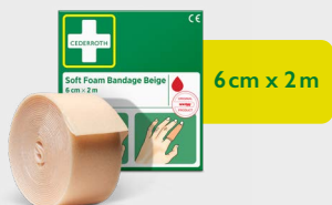
Cederroth Soft Foam Bandage Beige 6 cm x 2 m, REF 51011019

Klebstofffreier, selbsthaftender Verband, der sich leicht passgenau abreißen lässt. Es eignet sich für alle kleineren Wunden und sitzt auch bei Hitze, Kälte oder Nässe sicher. Nachfüllpackung für die Erste-Hilfe-Station.