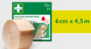
Cederroth Soft Foam Bandage Beige 6 cm x 4,5 cm, REF 51011020

Perfekt für Finger oder Zehen. Ideal zum Verbinden kleinerer Wunden. Bleibt auch bei Nässe an Ort und Stelle und löst sich nicht ab. Ein selbsthaftender, klebstofffreier Verband, der nicht an Haut und Haaren haftet. Passt in die Pflaster Spender Plus und Soft Foam Spender 2-in-1.