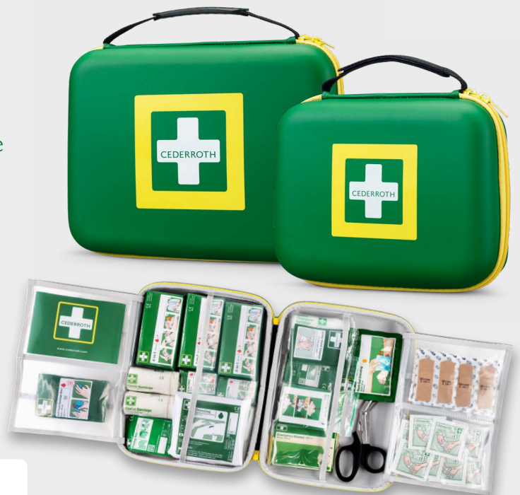
Das Bild zeigt First Aid Kit Large