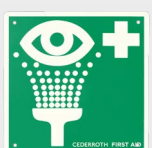
Schild Augendusche REF 1740