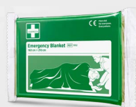
Cederroth Rettungsdecke REF 1892

Der Salvequick Wundreiniger ist der praktische Ersatz für Watte und Wundreinigerlösung. Inhalt: 20 x Salvequick Wundreiniger mit 0,9 % Kochsalzlösung. Passt in die Erste-Hilfe-Stationen.