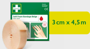
Cederroth Soft Foam Bandage Beige 3 cm x 4,5 m, REF 51011018

Perfekt für Finger oder Zehen. Ideal zum Verbinden kleinerer Wunden. Bleibt auch bei Nässe an Ort und Stelle und löst sich nicht ab. Ein selbsthaftender, klebstofffreier Verband, der nicht an Haut und Haaren haftet. Passt in die Pflaster Spender Plus und Soft Foam Spender 2-in-1.