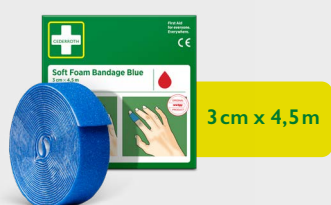
Cederroth Soft Foam Bandage Blue 3 cm x 4,5 m, REF 51011022

Ideal zum Verbinden kleinerer Wunden. Auch in beige und schwarz erhältlich.