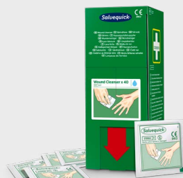
Salvequick Wundreiniger 40 Stk. REF 3227

Das Spray zur Reinigung und Spülung von Augen und Wunden. Entfernt wirksam Fremdkörper wie Schmutz oder Staub. Das Spray kann mehrmals verwendet werden und bleibt bis zum letzten Tropfen steril. Haltbarkeit: 5 Jahre.