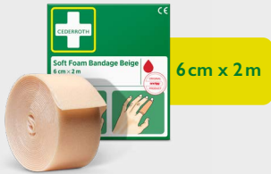
Pansement Autoadhésif Beige Cederroth 6 cm x 2 m, REF 51011019

Pansement autoadhésif sans colle qui se déchire facilement à la longueur souhaitée. Convient à toutes les plaies mineures et reste en place indépendamment des conditions de chaleur, de froid, d'humidité et de sécheresse. Recharge pour station de Premiers Secours.