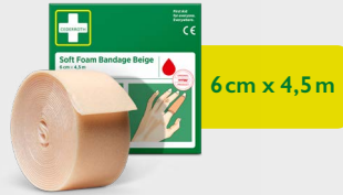
Cederroth Pansement Autoadhésif beige 6 cm x 4,5 m, REF 51011020

Facile à enrouler autour des petites mains ou lorsque vous avez une plaie mineure. C'est un pansement autoadhésif sans colle, ce qui l'empêche d'adhérer à la peau ou aux cheveux. Recharge pour Distributeur 2-en-1 de Pansement Autoadhésif.