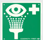
Douche Oculaire REF 1740