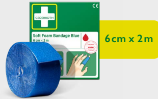
Pansement Autoadhésif Bleu Cederroth 6 cm x 2 m, REF 51011011

Pansement autoadhésif sans colle qui se déchire facilement à la longueur souhaitée. Convient à toutes les plaies mineures et reste en place indépendamment des conditions de chaleur, de froid, d'humidité et de sécheresse. Recharge pour station de Premiers Secours.