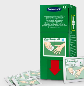
Lingettes Lave-blessure 40 pièces Salvequick, REF 3227

150 ml de solution de chlorure de sodium stérile conçue pour nettoyer et éliminer la poussière et les saletés des yeux et des blessures. Le spray peut être utilisé plusieurs fois et reste stérile jusqu'à la dernière goutte. Durée de conservation: 5 ans.