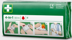
Stop-sang 4-en-1 Cederroth REF 1910

Pansement universel stérile spécialement conçu pour les doigts et les orteils. Des instructions claires sont imprimées directement sur l'emballage.