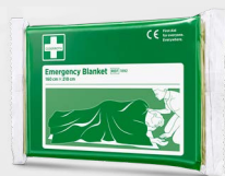
Couverture de Survie Cederroth REF 1892

Sachet réfrigérant pour soulager la douleur et réduire le gonflement, lors d'une entorse par exemple.