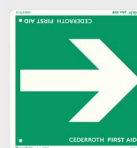
Flèche de Direction REF 1735