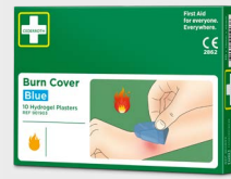
Pansements Pour Brûlure Cederroth REF 901903

Procure un rafraîchissement rapide et un soulagement efficace de en cas de brûlures et de coups de soleil. Le Gel Pour Brûlure Cederroth rafraîchit aussi efficacement que de l'eau tiède et accélère ainsi le processus de guérison.