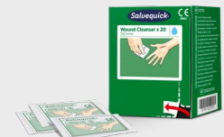
Lingettes Lave-blessure 20 pièces Salvequick, REF 323700

Les Lingettes Lave-blessure Salvequick remplacent le coton et les solutions de nettoyage des plaies en flacon. Contenu : 40 lingettes humides Salvequick avec une solution saline à 0,9 %. Emballées individuellement. Convient pour le Distributeur Soins des Plaies Cederroth.