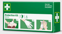
Kit de Protection Cederroth REF 2596

Gel à base d'eau pour brûlures mineures, coups de soleil et plaies dues à des radiations. Agit comme une barrière protectrice temporaire qui rafraîchit et apaise la peau tout en réduisant la douleur. Peut être utilisé plusieurs fois.