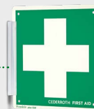
Croix Premiers Secours, REF 1738