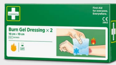
Compresses Pour Brûlure Cederroth 10 x 10 cm, REF 901900

Pansement universel stérile avec quatre fonctions: pansement compressif en cas de saignement important. Pansement de protection pour plaies superficielles. Pansement pour brûlure avec surface non adhérente de la compresse. Attelle temporaire. Des instructions claires sont imprimées directement sur l'emballage.