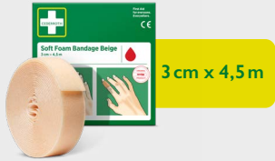
Pansement Autoadhésif Beige Cederroth 3 cm x 4,5 m REF 51011018

Facile à enrouler autour des petites mains ou lorsque vous avez une plaie mineure. C'est un pansement autoadhésif sans colle, ce qui l'empêche d'adhérer à la peau ou aux cheveux. Recharge pour Distributeur 2-en-1 de Pansement Autoadhésif.