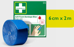
Cederroth Soft Foam Bandage Blue 6 cm x 2 m, REF 51011011

Limfritt, selvheftende plaster som lett kan rives av etter ønsket størrelse. Passer på alle typer sår uavhengig av varme, kulde – vått eller tørt, og den blir sittende på også i vann. Refill til Førstehjelpsstasjonen. Refill til First Aid Station.