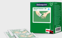
Salvequick Sårvask 20 stk REF 323700

Salvequick sårvask erstatter bomull og sårvask på flaske. Innhold: 40 stk. Salvequick våtservietter med 0,9% koksaltløsning. Passer i Cederroth Wound Care Dispenser.