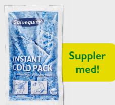
Salvequick Instant Cold Pack REF 219600

Teppes med varmereflekerende aluminiums-side som beskytter ved nedkjøling.