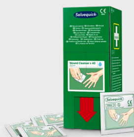
Salvequick Sårvask 40 stk REF 3227

150 ml steril koksaltløsning for å rengjøre og skylle bort støv og smuss fra øyne og sår. Sprayen kan brukes flere ganger og er steril til siste dråpe. Holdbar i 5 år.