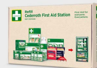
Refillpakke Til Cederroth First Aid Station REF 51011039

Kjølepose for å lindre smerte og minimere opphovning ved f.eks. forstuing.