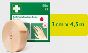
Cederroth Soft Foam Bandage Beige 3 cm x 4,5 m, REF 51011018

Det er et selvheftende limfritt plaster og kleber seg ikke til hud eller hår. Tilpasset for fingre eller tær. Lett å vikle rundt små hender eller når du har et mindre sår. Refill til Soft Foam Bandage 2-in-1 Dispenser.