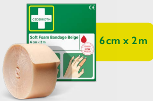
Cederroth Soft Foam Bandage Beige, 6 cm x 2 m REF 51011019

Limfritt, selvheftende plaster som lett kan rives av etter ønsket størrelse. Passer på alle typer sår uavhengig av varme, kulde – vått eller tørt, og den blir sittende på også i vann. Refill til Førstehjelpsstasjonen. Refill til First Aid Station.