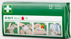
Cederroth 4-in-1 Blodstopper REF 1910

Steril universalforbinding som er spesielt egnet for fingre og tær. Tydelige instruksjoner er trykt direkte på forpakningen. Tydlige instruksjoner er trykket på forpakningen.