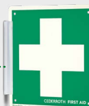
Skilt Førstehjelpskors REF 1738