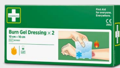
Cederroth Burn Gel Dressing 10x10 cm, REF 901900

Steril universalforbinding med fire funksjoner: Kompress for kraftige blødninger. Sårbandasje for overflatesår. Kompress for brannskader takket være kompressens sårvennlige overflate. Midlertidig støttebandasje. Tydelige instruksjoner er trykt direkte på forpakningen.