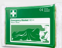
Cederroth Redningsteppe REF 1892

Salvequick sårvask erstatter bomull og sårvask på flaske. Innhold: 20 stk. Salvequick våtservietter med 0,9% koksaltløsning. Individuelt pakket. Passer i førstehjelpsstasjonen.