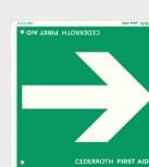
Skilt Retningspil REF 1735