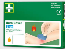
Cederroth Burn Cover REF 901903

Gir rask avkjøling og effektiv smertelindring ved brannsår og solforbrenninger. Gir raskere heling. Cederroth Burn Gel kjøler like effektivt som lunkenet vann.