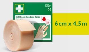
Cederroth Soft Foam Bandage Beige 6 cm x 4,5 m, REF 51011020

Det er et selvheftende limfritt plaster og kleber seg ikke til hud eller hår. Tilpasset for fingre eller tær. Lett å vikle rundt små hender eller når du har et mindre sår. Refill til Soft Foam Bandage 2-in-1 Dispenser.