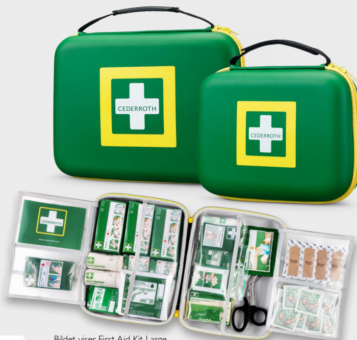
Bildet viser First Aid Kit Large