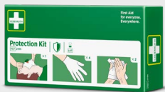
Cederroth Beskyttelsespakke REF 2596

Vannbasert gel for mindre brannskader, skåldinger og solskader. Fungerer som en midlertidig beskyttende barriere som kjøler og lindrer huden, og dermed reduserer smerten. Enkel å påføre, kan brukes flere ganger.