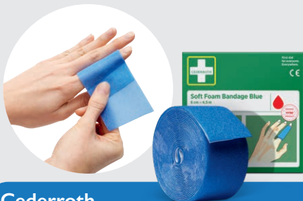
Cederroth Pansement autoadhésif Bleu 6 cm x 4,5 m, REF 51011010

Recommandé pour l'agroalimentaire où une grande visibilité est obligatoire - comme dans les cuisines, les restaurants ou la production alimentaire. La couleur bleue facilite la détection visuelle du bandage.