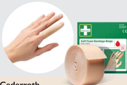
Cederroth Pansement autoadhésif Beige 6 cm x 4,5 m, REF 51011020

Recommandé pour l'agroalimentaire où une grande visibilité est obligatoire - comme dans les cuisines, les restaurants ou la production alimentaire. La couleur bleue facilite la détection visuelle du bandage.